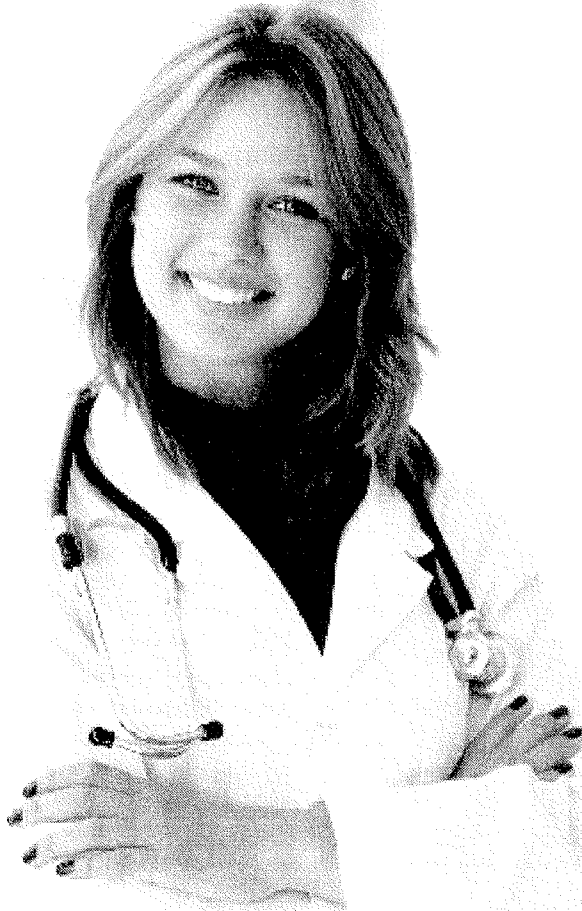
Tabela de preços e rede referenciada