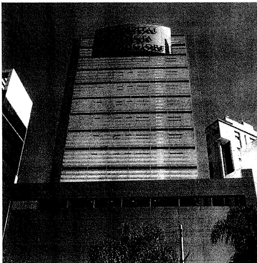
Hospital Sancta Maggiore Itaim

Desde a inauguração do primeiro hospital, em 1997, a rede Sancta Maggiore é especializada no atendimento da melhor idade e garante serviços médico-hospitalares de altíssima qualidade.